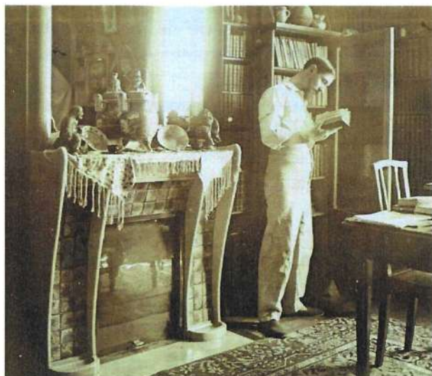
Album photo de Jacques Majorelle, Jacques dans sa chambre. Nancy, musée de l'École de Nancy ©MEN

Dans la mesure du possible, ces travaux n'occasionneront pas de fermeture de la Villa Majorelle au public, sinon occasionnellement du premier étage (chambre à coucher). Un tarif réduit sera appliqué dans le contexte des travaux.